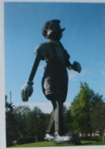
Från Pinocchio till Sjöbo